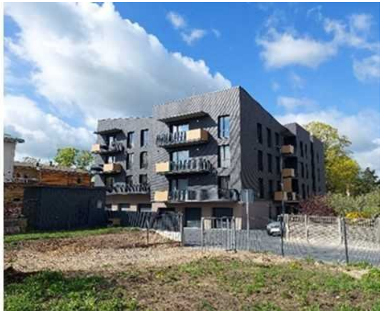
1 pav. Nuotrauka iki statinio rekonstrukcijos (objektai pažymėti raudonu apskritimu) ir objektas po rekonstrukcijos