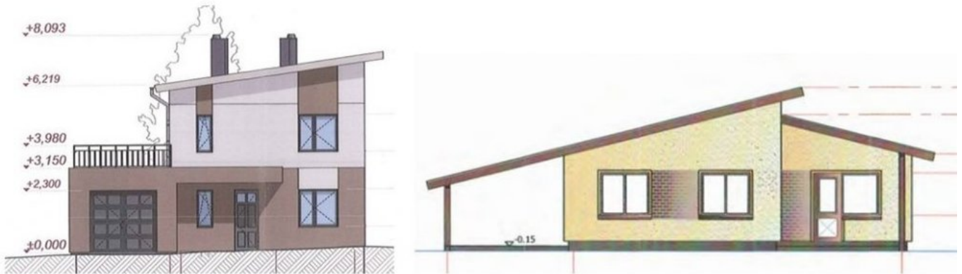
3 pav. Patvirtintuose projektuose: pagalbinio ūkio paskirties pastatai-dirbtuvės Zarasų (kairėje) ir Ignalinos (dešinėje) rajono savivaldybėse

Atlikdami analizę pareigūnai pastebėjo, kad už savavališkų statybų vykdymą numatytos sankcijos neatgraso nuo pažeidimų darymo. Korupcijos rizikos analizės metu nustatytos aplinkybės buvo perduotos Valstybinei teritorijų planavimo ir statybos inspekcijai, kuri dėl penkių atvejų surašė savavališkos statybos aktus, privalomuosius nurodymus nevykdyti jokių statinio ar jo dalies statybos darbų bei pašalinti savavališkos statybos padarinius.