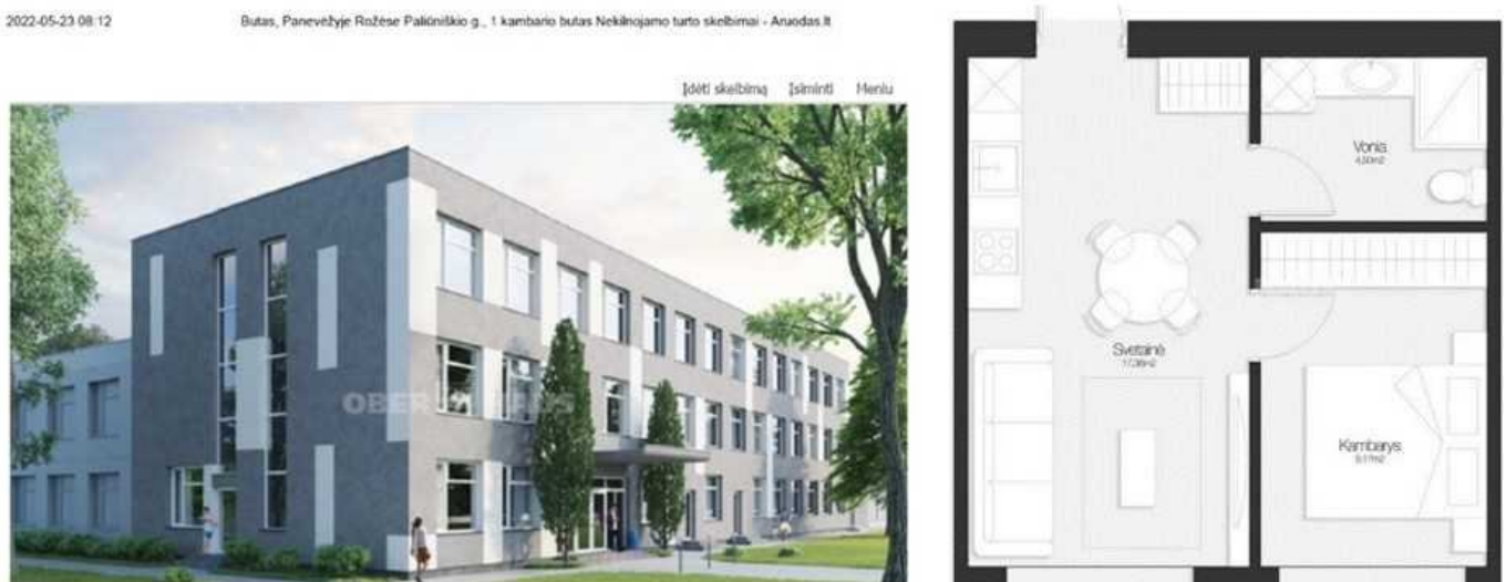
2 pav. Nekilnojamojo turto skelbimų portale pateikiamos administracinių parduodamų patalpų vizualizacijos

Pavyzdžiui, Panevėžio mieste statybą leidžiantis dokumentas buvo išduotas dėl administracinės paskirties pastato paprastojo remonto, tačiau minėtame projekte, kaip atskiri nekilnojamojo turto vienetai, suformuotos gyvenamosios patalpos, kurias siūloma įsigyti nekilnojamojo turto skelbimų portaluose.