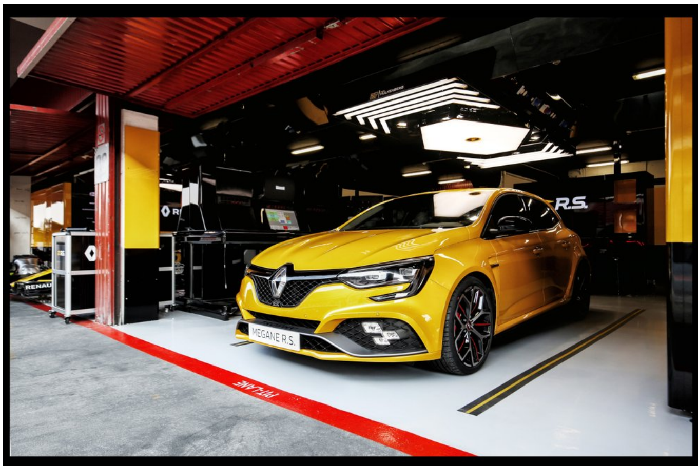
2018 - Nouvelle Renault MÉGANE R.S. TROPHY