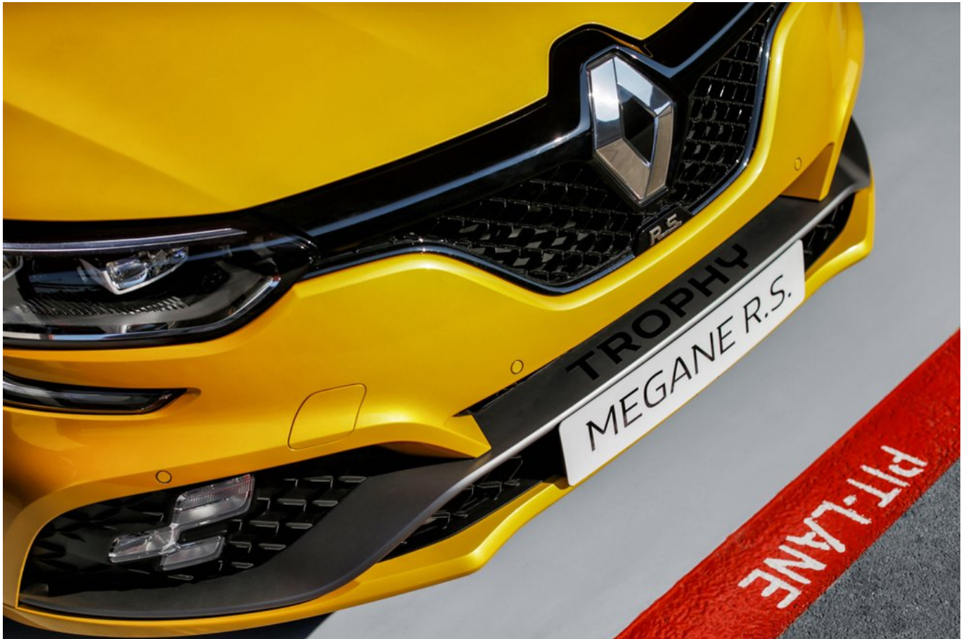
2018 - Nouvelle Renault MÉGANE R.S. TROPHY